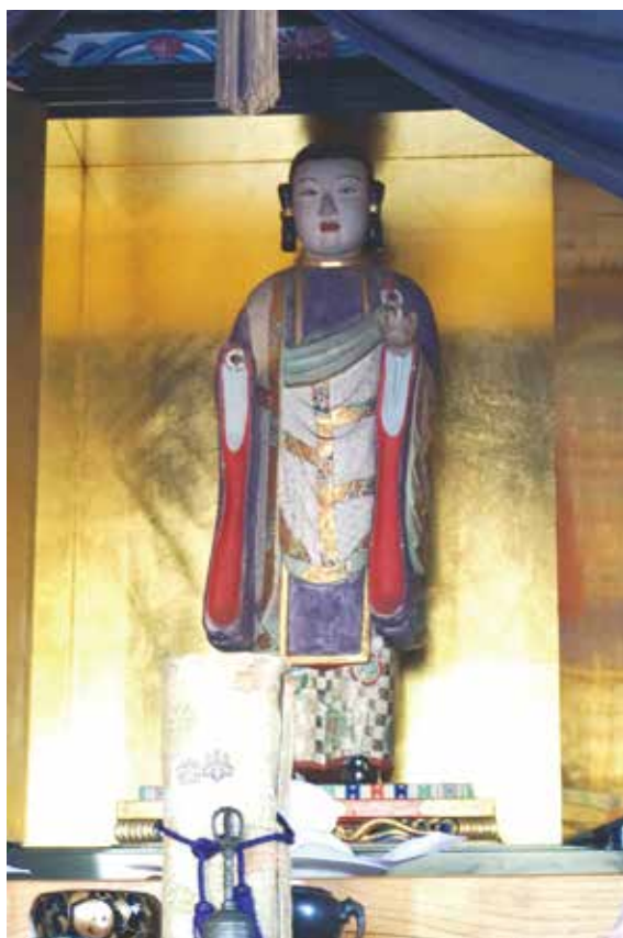
ご本尊の聖徳太子像