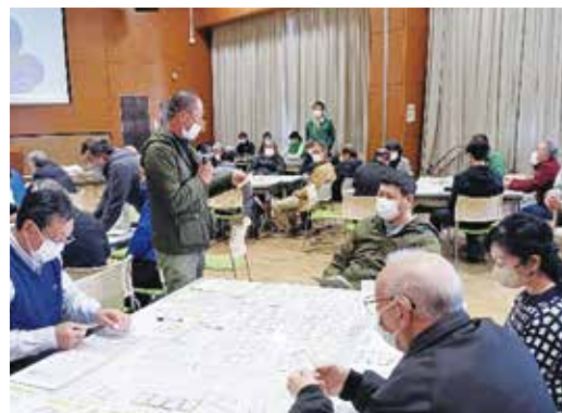
避難所運営ゲームHUGの感想発表