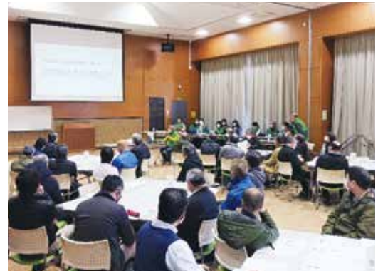
避難所運営ゲームHUGの説明

『避難所運営ゲームHUG』の命名は「Hinanzyo Unei Game」の頭文字で「ハグは抱きしめる」の意から、避難者を「優しく受け入れる」を意味します。