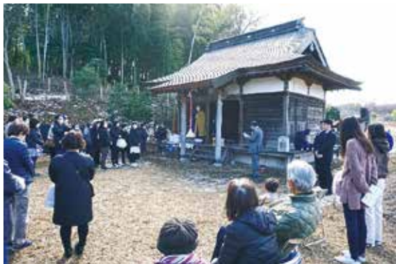
太子堂前の御開帳祭典