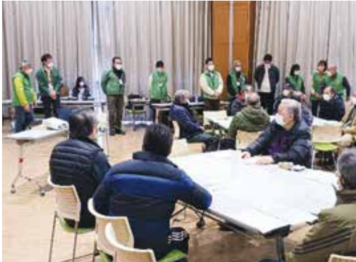
NPO法人栃木県防災士の紹介

当日は風水害を想定しハザードマップの確認、避難準備の為のマイ・タイムラインや風水害避難時の注意点などの説明を受け、その後「避難所運営ゲームHUG」を体験。チームで実際に避難所運営者として様々な課題の対処法を学びました。