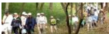
10/12(日)第 16 回歩け歩け大会