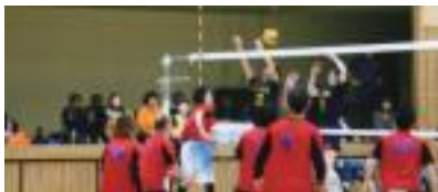
6/22(日) 一般バレーボール 大会