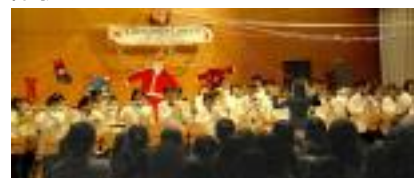
12/14(日) Xmas コンサート