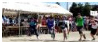
9/14(日)第 63 回体育祭