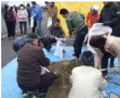
土のう積みは隙間なく!