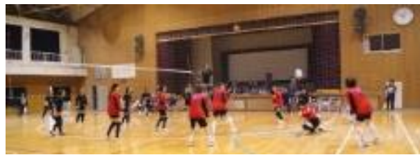
5/25(日)簡易バレーボール大会