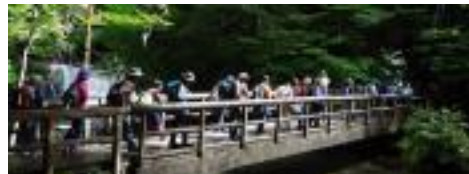
6/29(日)ス ポーツクラ ブ 夏山ハ イクング