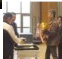
3/1(日) 体協 総合表彰式