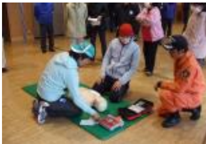
子どもたちも AED の体験やバケツ消火リレーに挑戦!