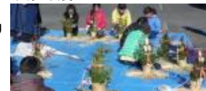
12/23(火・祝)→ 豊子連門松づくり