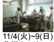
11/4(火)~9(日) 豊郷まつり 2014 体験ウイーク