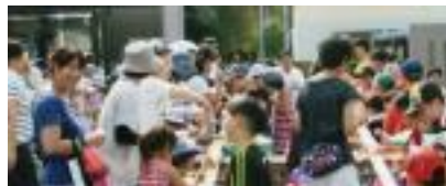
8/3(日)豊郷っ子 夏祭り子どもま つり