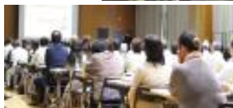
7/19(土)青少年を非行から守 る地区民の集い