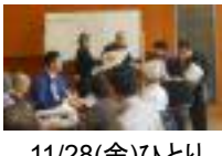
11/28(金)ひとり 暮らし高齢者ふ れあい会食