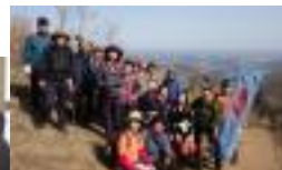
2/28(土)スポーツクラブ バス・ケーブルカー で行く「筑波山」