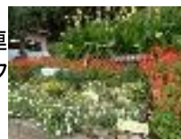
8/24(日)豊子連 花いっぱいコンク ールと表彰式