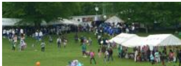
5/5(月・祭)子どもフェスタ in 文化の森