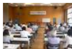
←7/6(日)豊郷地区社 協関係者合同研修会