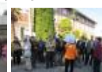
11/21(金)自治会長 研修・富岡製糸場