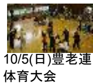
10/5(日)豊老連 体育大会