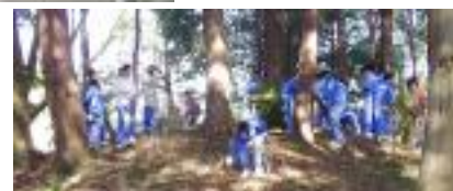
10/25(土) 北山古墳群清掃