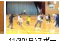
11/30(日)スポー ツクラブ秋のイ ベント