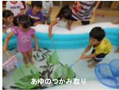
あゆのつかみ取り