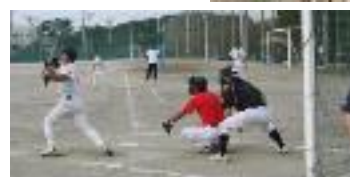
9/21(日) ソフトボール大会