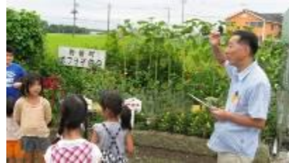
8/25(日)豊子連花いっぱいコンクール