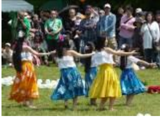
5/5(日・祭)子どもフェスタ in 文化の森