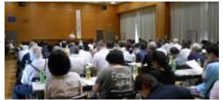
7/7(日)自治会長・民生委員・福祉協力員合同研修会