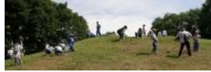
7/6(土)瓦塚古墳群清掃奉仕