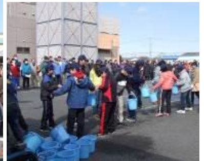
子ども消防団バケツリレー