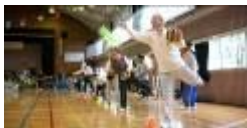
10/6(日)豊老連体育大会