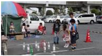
8/4(日)夏休み子ども祭り及びチャレンジランキング大会