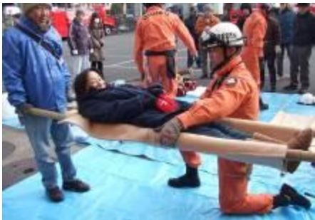
毛布で緊急時担架づくり

東日本大震災から3年・災害に強い地域づくりを目指して、地域の皆さん約300名が参加し防災訓練が実施されました。普段の生活では体験できない訓練に取り組むことで、大震災の教訓を忘れず、自助・共助を意識することができました。