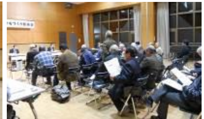
参加者からの質問