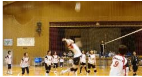
5/26(日)簡易バレーボール大会