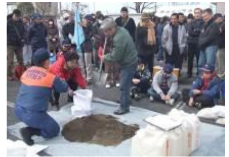
土のうづくり訓練