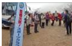
3/1(土)スポーツクラブバスハイク足利へ