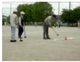
5/19(日)豊老連グラウンドゴルフ