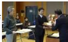
3/2(日)体協総合表彰式