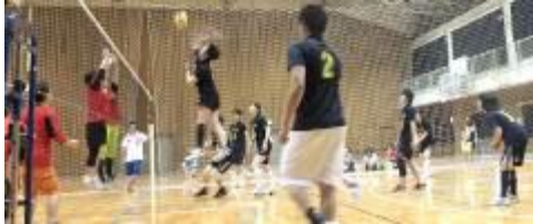
6/23(日)バレーボール大会